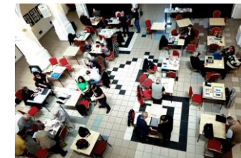
pohled do dvorany muzea

Bez přátelství nestojí život za nic. / Cicero /