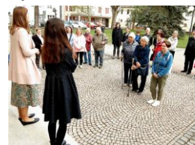
zahájení Muzejní noci