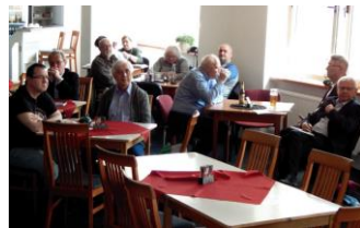
pohled do sálu