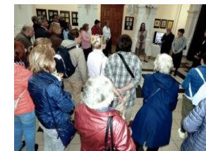
představení rodiny Jelenových