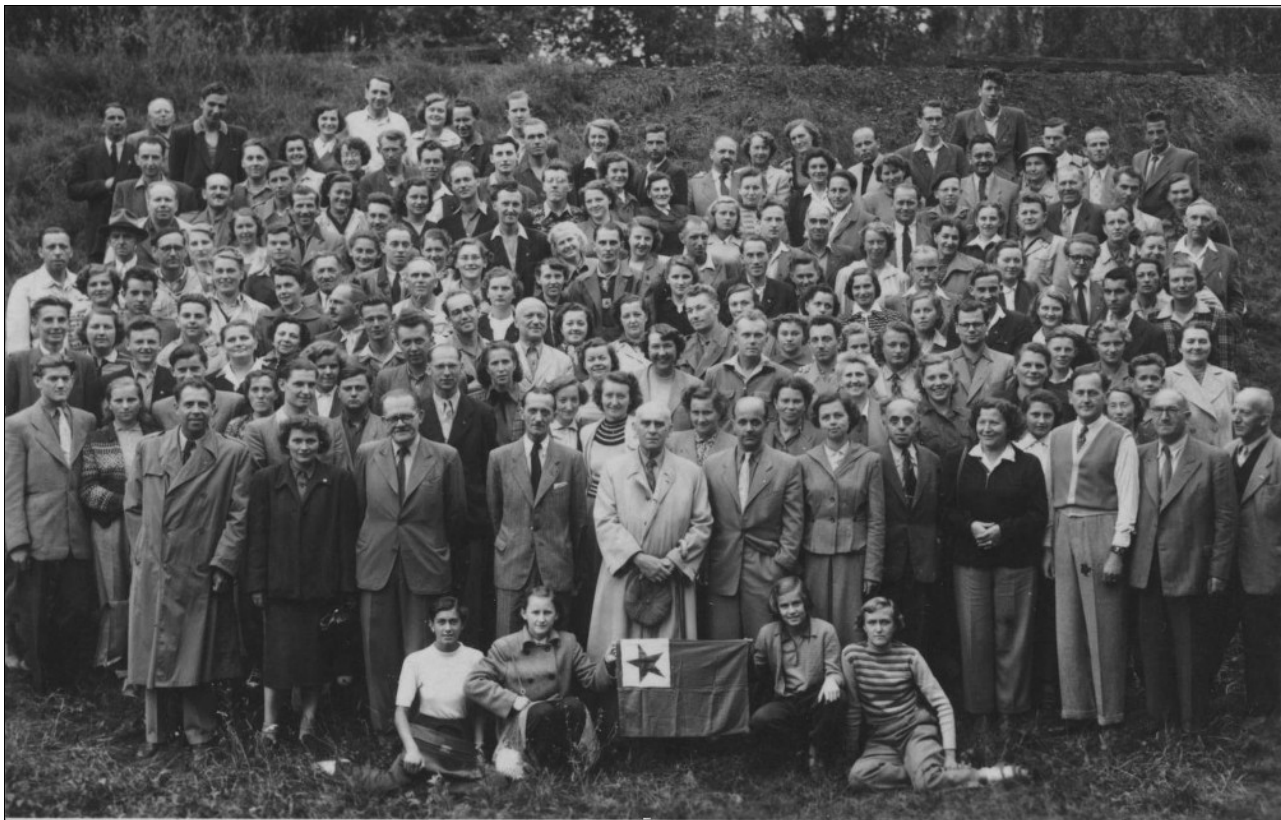
Diplomo de Doksy 1952