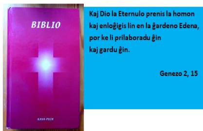
Temo de la Kongreso

Temo de la kongreso estis ekologia. Ni rememoris la 15-an version de la 2-a ĉapitro de la libro Genezo: „Kaj Dio la Eternulo prenis la homon kaj enloĝigis lin en la ĝardeno Edena, por ke li prilaboradu ĝin kaj gardu ĝin“.