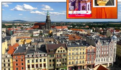
Świdnica. Vidajo de sur urbodoma turo.

Venonttage ni povis admiri la urbon Świdnica de sur renovigita urbodoma turo (2012), kiu estas 58 m alta kaj havas 10 etaĵojn.