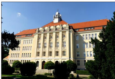
Porpastra Domo en Legnica.

Nia kongresejo troviĝis en grandega Porpastra Domo en Placo de Johano Paŭlo la 2-a.