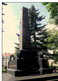
Monumento de rusa marŝalo Miĥail Kutuzov (1747 – 1813), kiu en Bolesławiec mortis.

En Bolesławiec havas sian monumenton fama rusa militestro marŝalo Miĥail Illarionoviĉ la princo Goleniŝĉev-Kutuzov-Smolenskij (1747 – 1813). Ni scias lin kiel heroon de militoj kontraŭ Napoleono (ekzemple de batalo apud Aŭsterlico, la 2-an de decebro 1805). En Bolesławiec Kutuzovi malvarmumis kaj mortis de pneŭmonio.