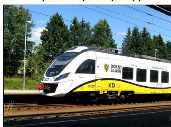
Trajno de Malsuprasileziaj Fervojoj.

Ni veturis el Brno trans Ústí nad Orlicí en lastan bohemian fervojan stacion Lichkov. Tie ni prenis polan trajnon kaj kontinuus en Vroclavo-n. Bedaŭrinde lokomotivo de pola trajno havis difekton, tial ni pli ol du horojn atendis novan trajnon. En Vroclavo ni trovis alian trajnon, kiu iris en Legnica-n. Kiam ni en Legnica trovis nian kongresejon, jam estis mallumo.