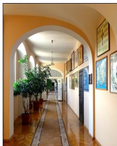
En Porpastra Domo en Legnica.

La Porpastra Domo estas grandega. Ĉie estis beleco, pureco kaj ordo.