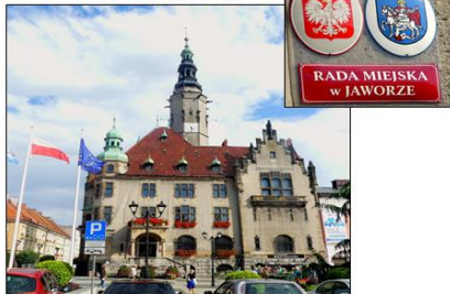
Urbodomo en Jawor.

Polaj samideanoj el Vroclavo ŝatas danci. Tial ili dancis ankaŭ sur scenejo de urba teatro en Jawor.