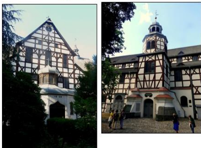
Kirko de Paco en Świdnica.

Trezoro de Świdnica estas Kirko de Paco el la 17-a jarcento, kiu estas la plej granda ligna preĝejo en Eŭropo.