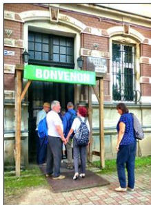
Post reveno el ekskurso.

Post reveno el ekskurso atendis nin gastama Porpastra Domo en Legnica, kies unu enirejo estis ornamita per esperanta saluto „Bonvenon!“ Kaj ankaŭ bongusta vespermanĝo.