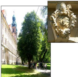
Postcisterciana monaĥa komplekso en Lubiąż.

La 8-an de aŭgusto ni vizitis postcistercianan monaĥejan komplekson en Lubiąż, kie ni aŭskultis koncerton de muzika grupo „Kamerata Autentik“.