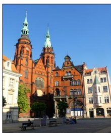
Katedralo en Legnica.